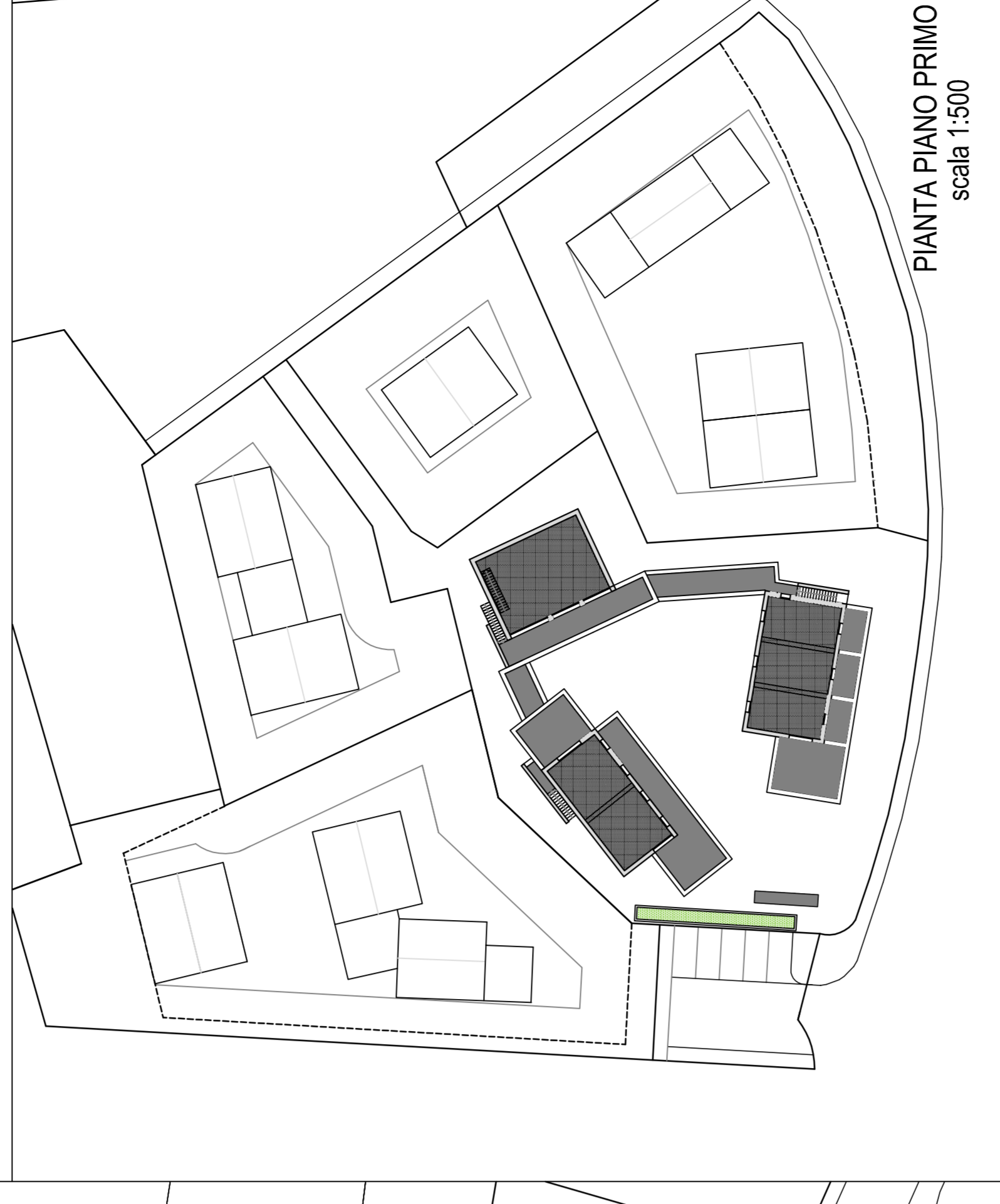
PIANTA PIANO PRIMO scala 1:500