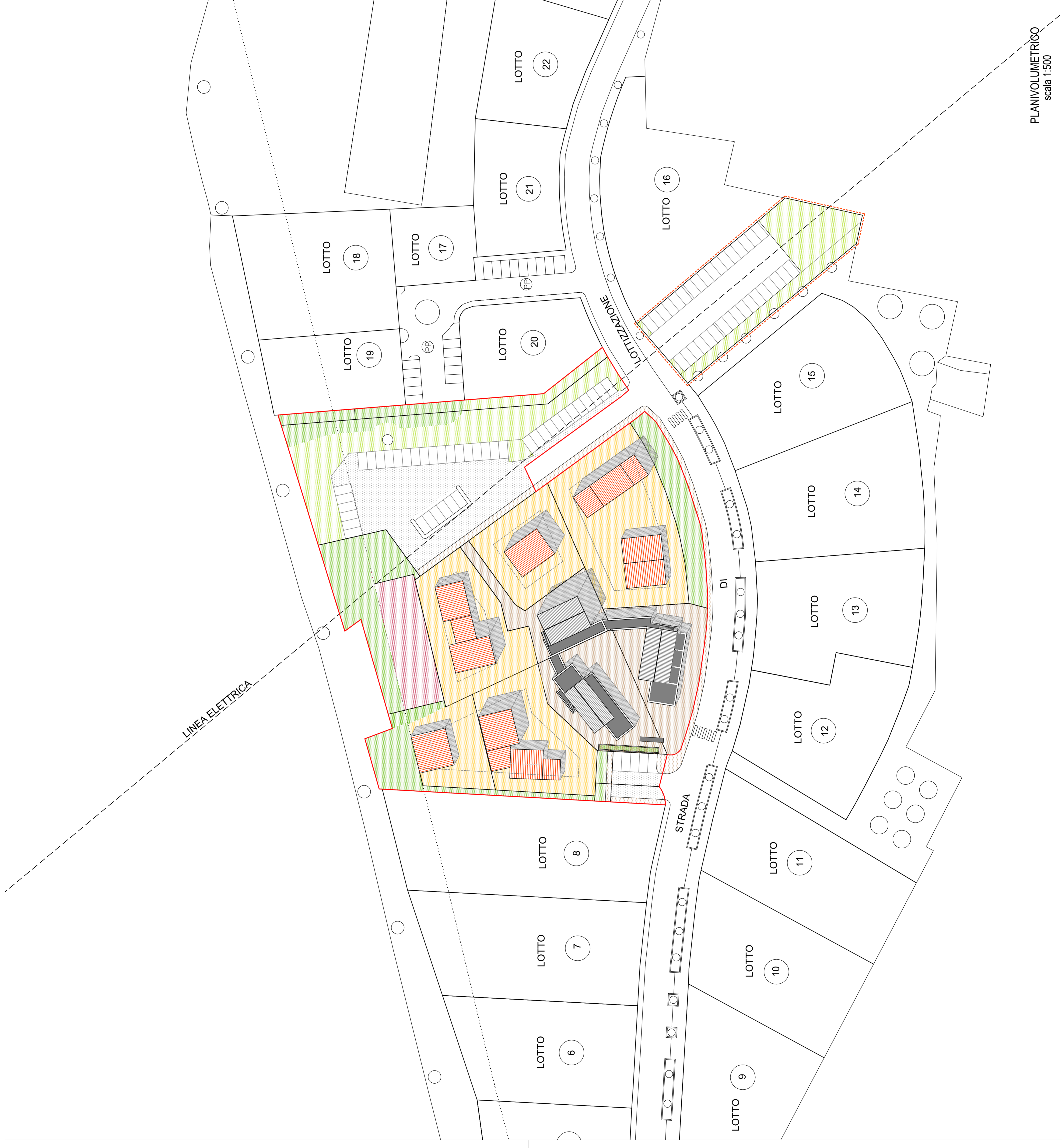
PLANIVOLUMETRICO scala 1:500